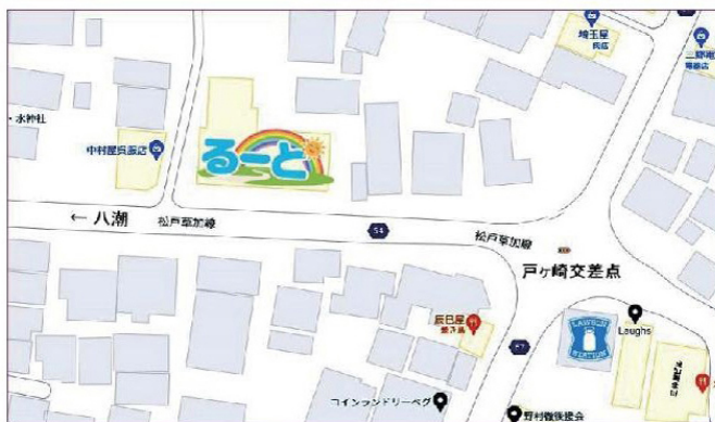
TX八潮駅南口より戸ヶ崎十字路までバスで5分徒歩2分